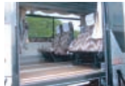
リフト稼働時の車内