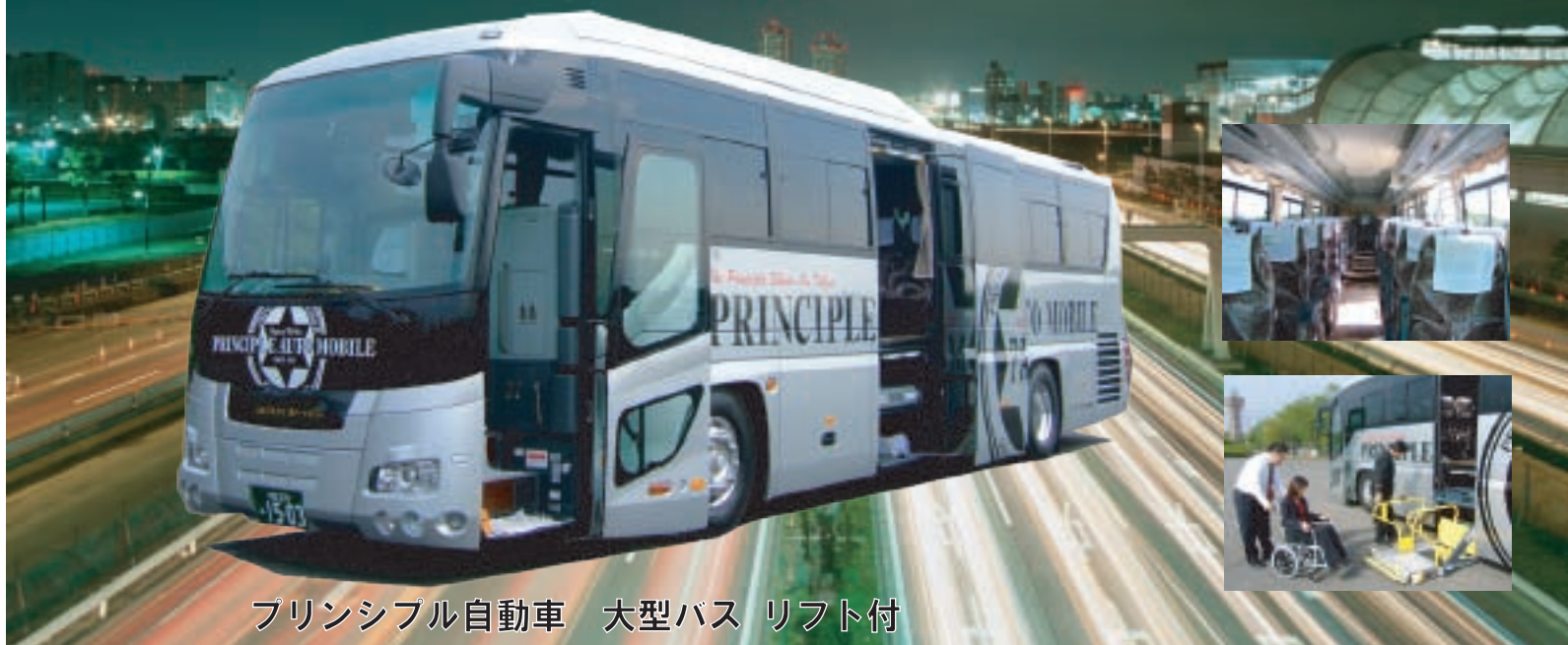
プリンシプル自動車 大型バス リフト付

Please enjoy a free trip by Principle delux bus.