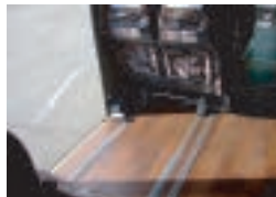
リフト稼働時の車内