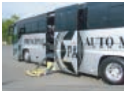
リフトで安全に乗車できます

49名乗り 正席45席 + 補助席4席 43名乗り 正席37席 + 補助席4席 + 車椅子2席