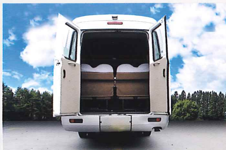
(A) 広々カーゴスペース