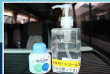
手指の消毒に ご利用ください