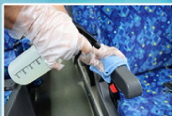
車内除菌には キーパープロHLを利用

車両の日常点検時に消毒用アルコール液・空間除菌製品の設置・確認。座席など、お客様の手に触れる場所の消毒を行い、車内空間には除菌液の散布を行います。