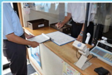
対面での体調チェック