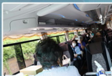
運行中のマスク着用をお願い致します。