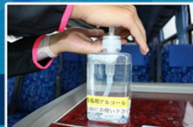
こまめな手指の消毒に ご協力お願いいたします

運行中に体調不良などございましたらお気軽に乗務員にお申し出下さい。感染拡大防止のため、感染予防対策へのご協力をお願いいたします。