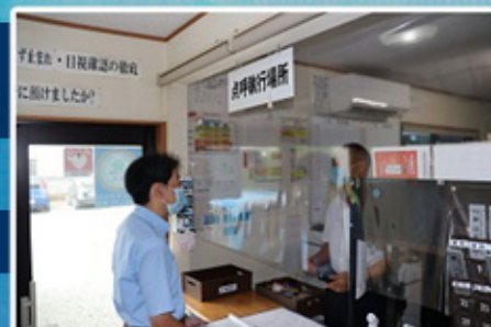
飛沫防止シートの設置